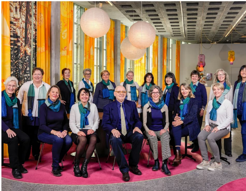
Guides von St.Gallen-Bodensee Tourismus